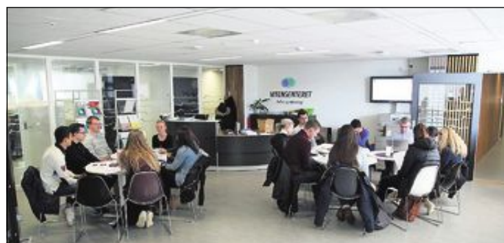
TRE SCENARIOER: Studenter på Høgskolen i Sørøst-Norge jobber med scenarioer for framtidens HelseNorge.